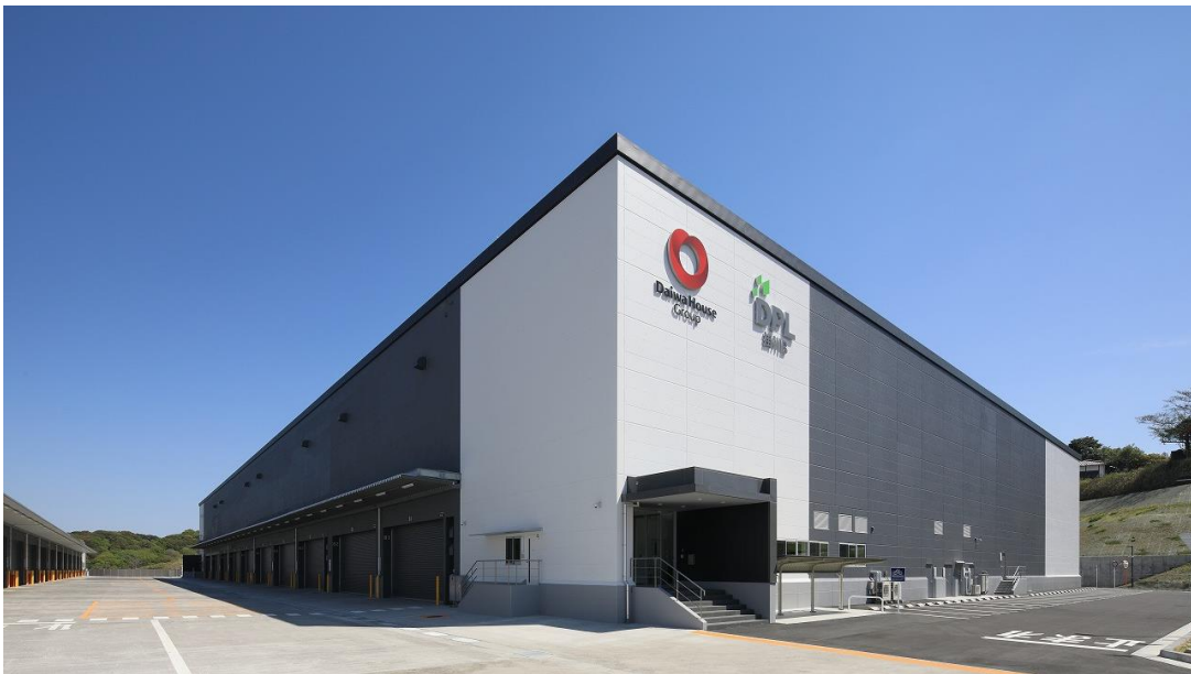
【掛川物流センター 外観】