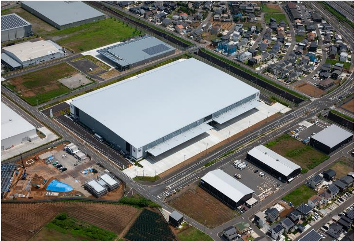
【倉庫外観（空撮写真）】