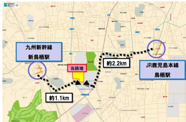
【 現地図 】