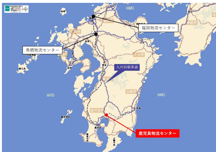
【九州での当社事業拠点】