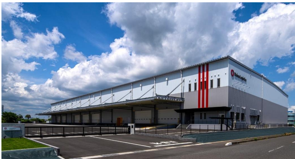
【鹿児島物流センター】

大和ハウスグループの大和物流株式会社（本社：大阪市西区、社長：杉山克博）は、2024 年 4 月から鹿児島県霧島市で開発を進めていた物流施設「鹿児島物流センター」（以下「本センター」）を竣工し、2025 年 6 月 1 日から稼働を開始しました。