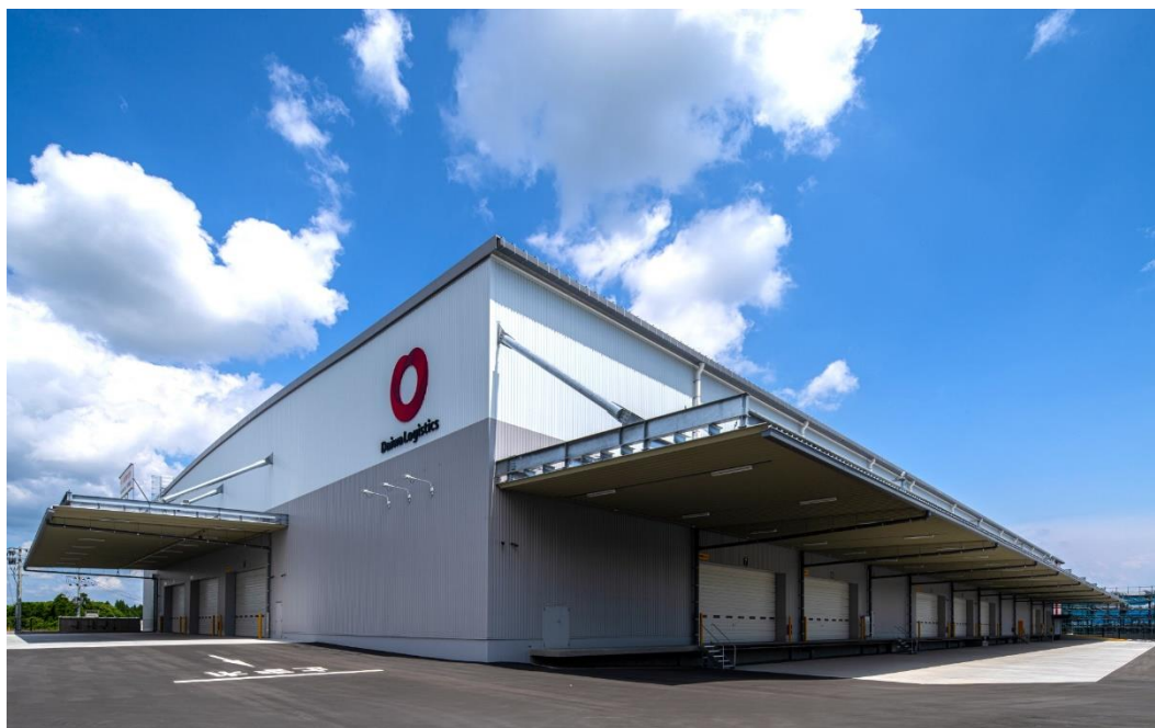
【トラックバース 右：高床、左：低床】