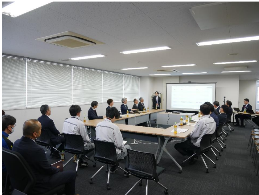
【「物流革新プロジェクト」キックオフのようす】

本プロジェクトでは、横河電機の子会社である横河マニュファクチャリング株式会社の伴走支援のもと、同社の組織変革メソッドを導入し、製造業の現場で培われた高度な標準化・品質管理手法を物流オペレーションに融合させます。これにより、属人化の解消を図り、安全性と効率性を備えた水準として、より高度化した「大和物流クオリティ」を、全国どの拠点でも安定的に提供できる体制を確立。激変する物流環境下において、荷主企業様のサプライチェーンを将来にわたり強固に支えるパートナーシップの構築を目指します。