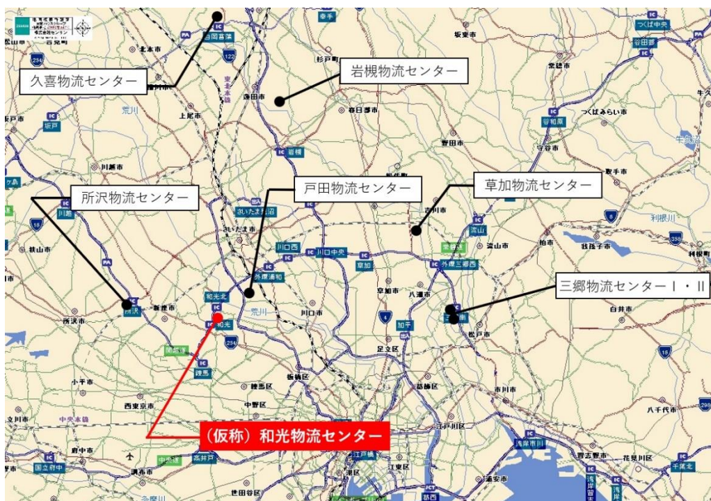
【埼玉県下での当社物流センター】