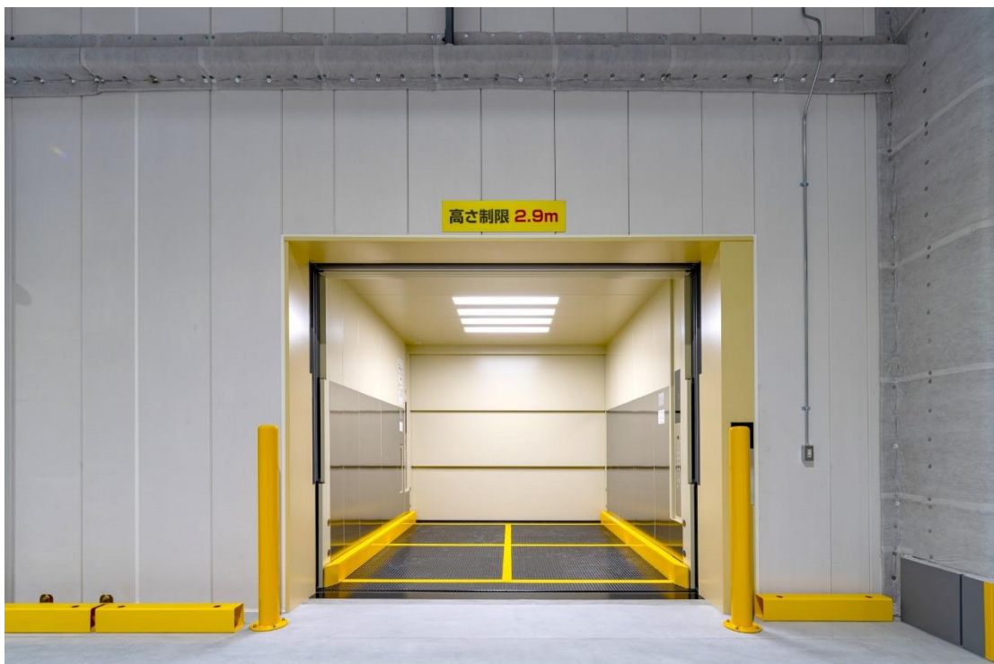
【荷物用エレベーター】